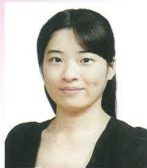
清水 美沙 メゾソプラノ