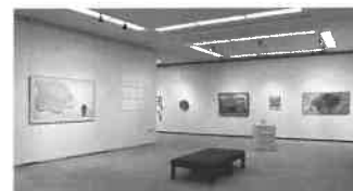
※写真：前回作品展の様子