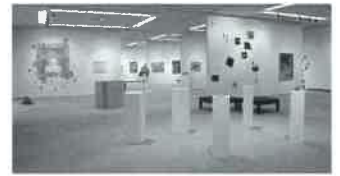
※写真：前回作品展の様子