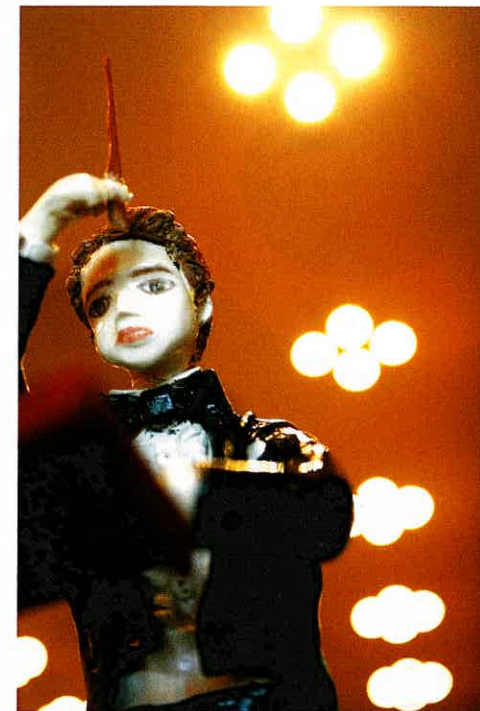
マエストロとは大音楽家、巨匠の意。指揮者の敬称としても用いられます。

大ホールと中ホール、それぞれの入り口のほぼ中間に位置する場所に、人形オーケストラたちのステージがあります。この人形たちは、ロゼシアターオープンの際、富士市の文化の発展を願う有志によって作られました。美しいバイオリン、ユーモラスなチェロ奏者、チューバのお爺さんの優しい眼差し、団員たちは皆、個性豊かな面々です。そしてタクトを握るのは、写真のマエストロ。栗色の髪に端正な顔立ちながらも、普段客席に背を向けた存在ゆえ、その素顔は知る人ぞ知るといふもの。今回特別にご登場願いました。オーケストラを率い今年13年目の小さな巨匠。今なお心温まる演奏で、訪れる人々を魅了しています。