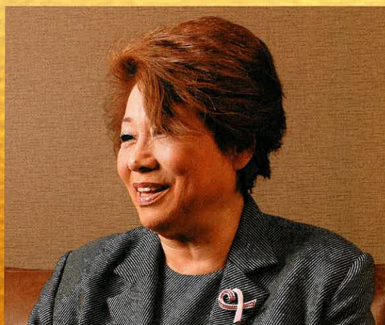
取材文／飯野之也

実は私、熱海に疎開してなんです。私にとって懐かしい静岡県で芝居することを楽しみにしています。 是非見にいらしていただきたいと思ひます。 今日はありがとうございました。