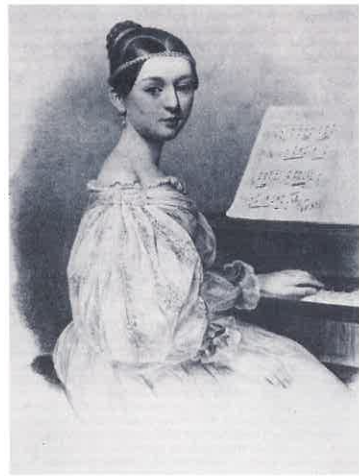
(写真:2)少女時代のクララ

クララは、ピアニストになるべくして生まれたといっている女性でした(誕生日は、一八一九年九月十三日)。父親ウィークは、娘に芸術的感性が備わっていると確信するやいなや、直ちに音楽の英才教育を課します。九歳、ライプツィヒ・ゲヴァントハウスで初舞台。十二歳で正式にピアニストとして活動をはじめたクララ(写真・2)。ちょうどその頃、ひとりの青年が、父のピアノの弟子としてクララの前に現れます。彼こそ、のちにクララの夫となるロベルト・シューマンでした。ロベルトはこのとき二十歳。まだ法科大学の学生であり、法律家か、それとも音楽家かという人生の岐路に立つ悩める青年でしたが、十歳を過ぎたばかりの少女クララは、すでにピアニストとしての道を着実に歩み始めていました。クララが十七歳の春、ベルリンで演奏したプログラムが残っています。バッハのフーガ、メンデルスゾーンのカプリス、シヨパンのノクターンとエチュード、ベートーヴェンの熱情ソナタというプログラムは、とても百八十年前のものとは思えないほど意欲的で多彩であり、そのまま現代のピアノ・リサイタルにしても全く違和感もない現代的な構成でした。