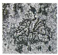
阿倍仲麻呂 (あべのなかまろ 698~770) 養老元年(717年)に吉備真備らとともに遣唐留学生として唐に渡る。玄宗皇帝の寵愛を受け宮廷で活躍。唐で没する。