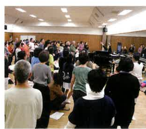
ワークショップ初日

劇場に響き渡る重厚な低音から透き通るような高音までを自在に操るゴスペル・カルテット「ニューヨーク・ゴスペル・ブラザーズ」が来日し、美しいハーモニーと圧倒的歌唱力で聴衆を魅了しました。そして、公演のアンコールでは、この日のために結成された市民クワイア「ロゼ・ゴスペルクワイア2018」が、最高の笑顔でステージに立ち、本場ブロードウェイで活躍するメンバーと共演。全編英詞の3曲を堂々と披露し、公演を終えました。