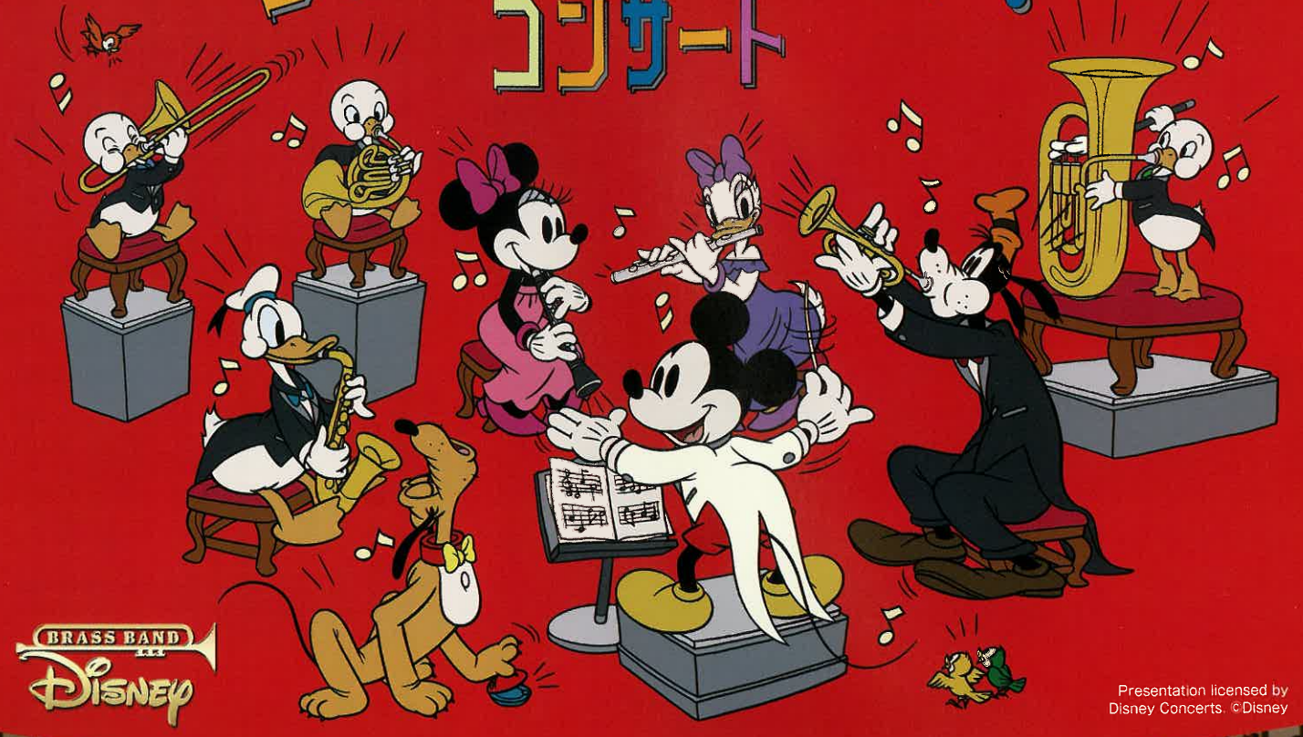
Presentation licensed by Disney Concerts. ©Disney