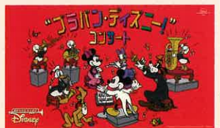
Presentation Licensed by Disney Contents. ©Disney

公演日/7月6日(土) 大ホール 開場/13:00 開演/14:00 入場料(全席指定・税込) S席:7,500円 A席:6,500円 学生:3,000円 ※未就学児入場不可