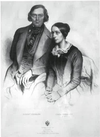
(写真:3)シューマン夫妻の肖像

クララとロベルトが恋に落ちたのは、クララがまだ十六歳にもならない頃のことでした。ところが、ふたりの関係を知ったクララの父ウィークは激怒!ロベルトに会うことを禁じ、「会いに来たら彼を撃ち殺す」とまで脅すのです。厳しい父親の監視の隙を縫って、ふたりは秘密の文通を重ね、互いへの想いはますます募ります。「わしはクララをピアニストにするために育てた。主婦にするためではない!」というのが、父ウィークの主張でした。もはや結婚の許しを得るための説得は不可能と悟ったふたりは、ライプツィヒの裁判所に訴えます。そして、翌年の一八四〇年八月、勝訴の判決。ようやくふたりの結婚が法的に認められます。恩師であり義父となる人と争うという苦難の道ではありましたが、この年だけで、ロベルトは『リーダークライス』『ミルテの花』『女の愛と生涯』『詩人の恋』という珠玉の歌曲集を次々と書き残しています。ロベルトはクララという理想の伴侶を得て、まさに幸福の絶頂にあったのです(写真・3・4)。