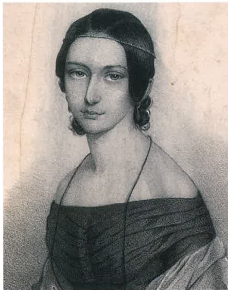
(写真:1)クララ・シューマンの肖像

いまから、ちょうど二〇〇年前の二八一九年、ドイツ・ライプツィヒのピアノ教師フリードリヒ・ウィークの第二子として誕生したクララ・ヨゼフィーネ(写真・1)。のちにロベルト・シューマンの妻となる彼女こそ、十九世紀を代表する女流ピアニストとして、かのフランツ・リストにも匹敵する名声を誇った音楽家でした。今回から二回にわたってお届けするのは、才能にあふれ、精神を病んだ天才音楽家の夫を愛し、支え、四男四女を産み、育児の傍らヨーロッパ各地での演奏旅行に奔走し、作曲家、教育者としても活躍した、まさに驚嘆すべきひとりの女性の物語です。