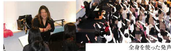
全身を使った発声