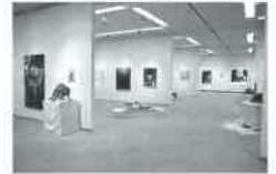
※写真 前回作品展の様子