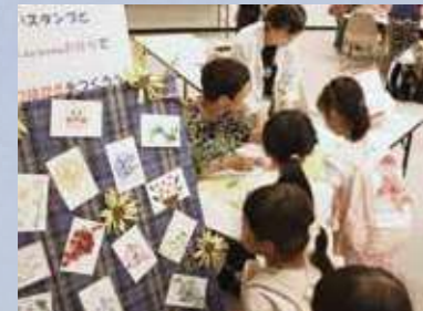
スタンプラリーの様子