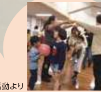
日常の多言語活動より

活動場所は日本全国に約700か所あり、関東部には富士・富士宮・沼津・御殿場にあります。週1回~何回でも参加でき、ゲームや歌を交え楽しみながら活動しています。地域の会員には、約1年間の高校留学でロシア・フランス・ドイツ・アメリカ・メキシコなどに行った若者たちや、ロシア・アメリカ・アジア各国に1週間~1か月間のホームステイやキャンプに出かけた青少年たち、子連れや単身で参加した人たちがいます。またホームステイの受け入れも近隣の日本語学校の生徒さんや横国大の留学生たちなど、年間を通して行っています。