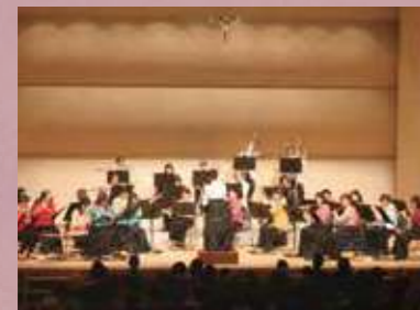
2019年9月22日 ロゼシアター小ホール 第36定期演奏会