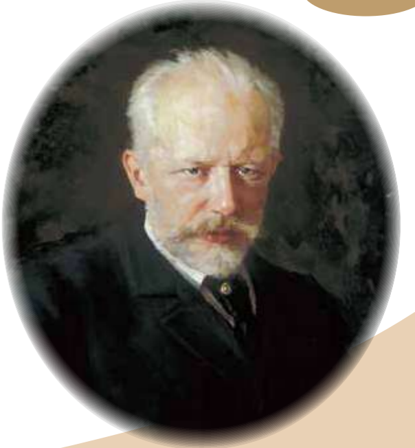
晩年のチャイコフスキーの肖像

その哀愁を帯びた旋律の美しさで世界的な人気を誇るチャイコフスキー。彼は、ロシアの作曲家としてはじめてヨーロッパで有名になったひとりでもありません。ところで、その名曲誕生の影に、ひとりの女性の存在があったことをご存じでしょうか。今回は、近代ロシアを代表する作曲家チャイコフスキーと、その創作を支え続けたひとりの女性との類いまれな友情の物語です。