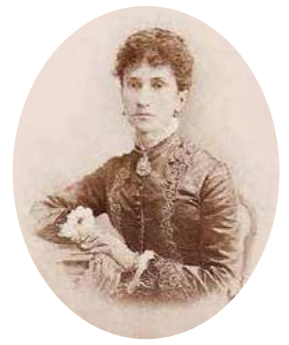
フォン・メック夫人の肖像

チャイコフスキーの生涯は、後半生の数々の栄誉とともに、前半生は挫折や屈辱を味わうという波乱に満ちたものでした。三十六歳のとき、彼のまえにひとりの女性が現れます。彼女の名は、ナ