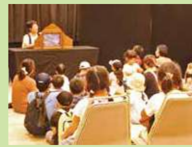
スタンプラリーの様子