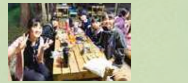
箱根の里キャンプ