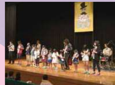
2019年10月5日 45周年記念例会「ピアノの魔術師」