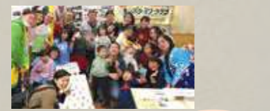
国際交流イベントにて