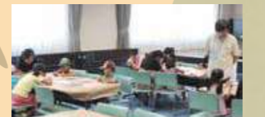
スタンプラリーの様子