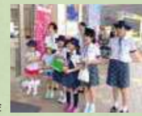
みどりの羽根募金

富士市教育プラザを起点に、富士市主催のブナ林植樹事業、福祉まつりに募金活動、清掃活動に参加、国際交流、ホームステイ、日本文化体験(茶道・琴)、デイサービス訪問や陶芸、料理、クラフトなど様々なことにチャレンジしています。ガールスカウト活動は、少女たちの可能性をのび社会に貢献して生きる力を育てています。