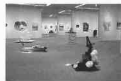
※写真:前回作品展の様子