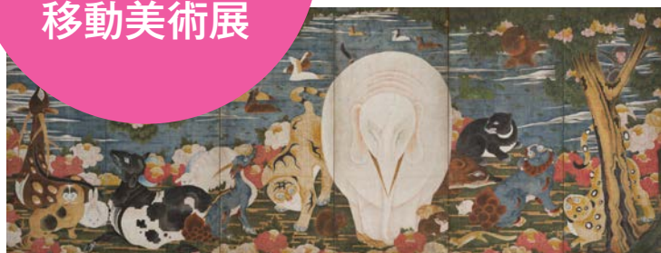
伊藤若冲《樹花鳥獣図屏風》(複製)