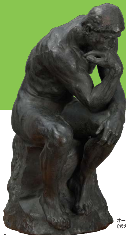
オーギュスト・ロダン 《考える人》(小型)