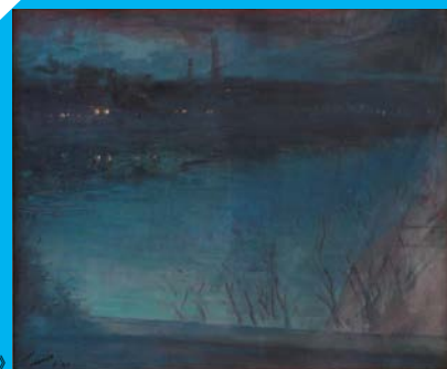
田中保《セーヌの背》