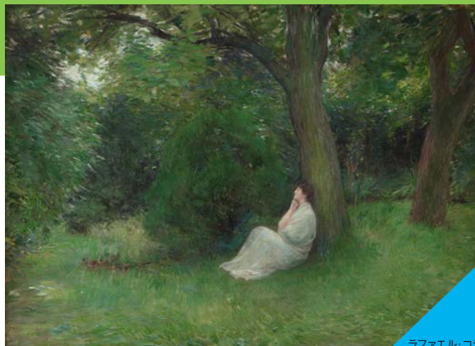
ラファエル・コラン《想い》