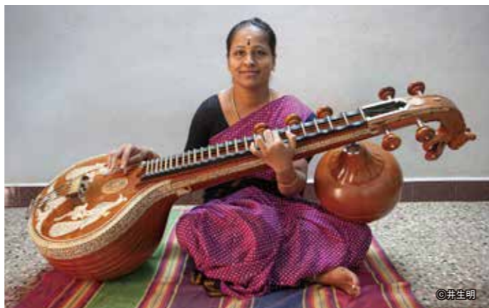
南インドの弦楽器 ヴィーナ

この絵画は、1770年頃にインドのブーンディ派によって描かれた「ヴァサント・ラギニ (Vasant ragini)」です。インド音楽の伝統的な「ラーガ」を視覚的に表現した「ラガマラ(ラーガの首飾り)」と呼ばれる絵画シリーズの一枚です。