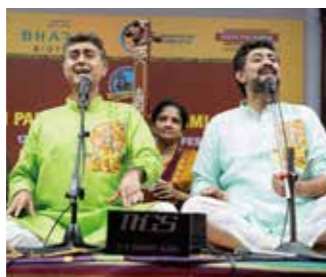
ヴォーカル トリシュール・ブラザーズ

日時: 11月8日(日) 開場14:00 開演14:30 会場: 小ホール 入場料: (全席指定・税込) 一般 4,400円 ペア券 8,000円 ※未就学児入場不可