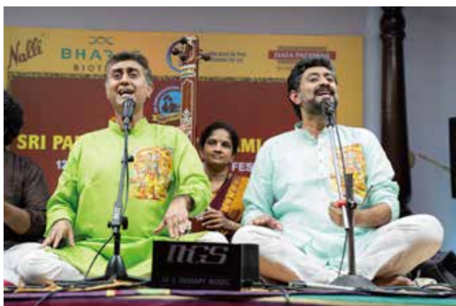
ヴォーカル トリシュール・ブラザーズ

続いては「特集 カルナータカ音楽とは?」 南インド音楽についてさらに詳しく解説します!