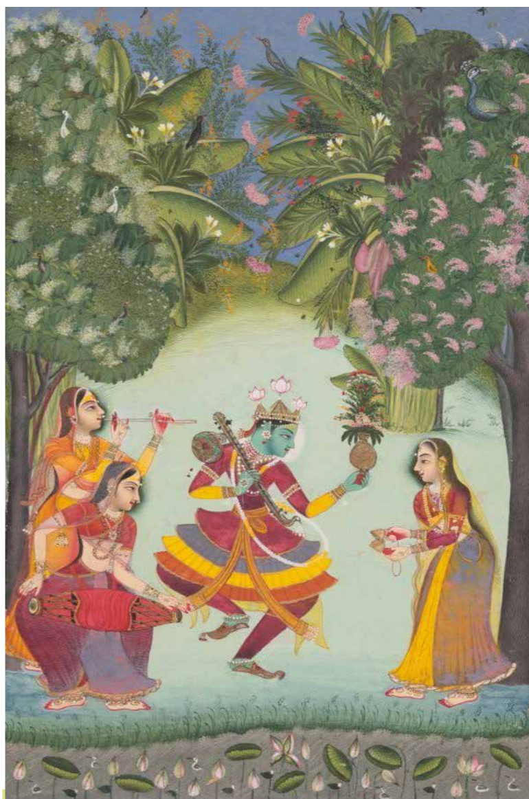
Vasant ragini circa 1770 by Bundi school

この絵画は、1770年頃にインドのブーンディ派によって描かれた「ヴァサント・ラギニ (Vasant ragini)」です。インド音楽の伝統的な「ラーガ」を視覚的に表現した「ラガマラ(ラーガの首飾り)」と呼ばれる絵画シリーズの一枚です。