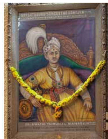
マハーラージャでありながら作曲もしたスワティ・ティルナール

遠い昔、神への献身を自らの言葉で表現し歌った古の楽聖たち(宗教家でもあり、作曲家でもあり、音楽家とも言える)が作った曲が今に至るまで歌い継がれ古典音楽として親しまれている。中には、マハーラージャ(藩王)でありながらも芸術を愛し、自身でもカルナータカ音楽の曲を多く残したスワティ・ティルナールという人もいる。