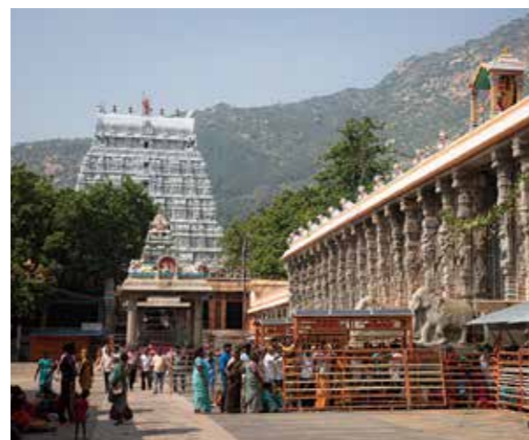
ゴプラムと呼ばれる塔門が特徴的な南インドのヒンドウ寺院

世界最大の人口、広大な国土、文化的多様性を誇るインドには二つの古典音楽がある。北インドの古典音楽「ヒンドウスターニー音楽 (Hindustani Music)」、そして南インドの古典音楽「カルナータカ音楽 (Carnatic Music)」だ。一九六〇年代にイギリスのバンド「ビートルズ」が自身の音楽に取り入れたこともあり、日本では圧倒的に北インドのヒンドウスターニー音楽の方が有名だ。悠久のインドというイメージにぴったりの音楽で、宮廷を中心に発展。きらびやかでロマンティック、うっとり陶醉するような雰囲気魅力的だ。だがロゼシアターにやってくるのは、カルナータカ音楽。こちらは日本ではまだまだ知られていない音楽だ。