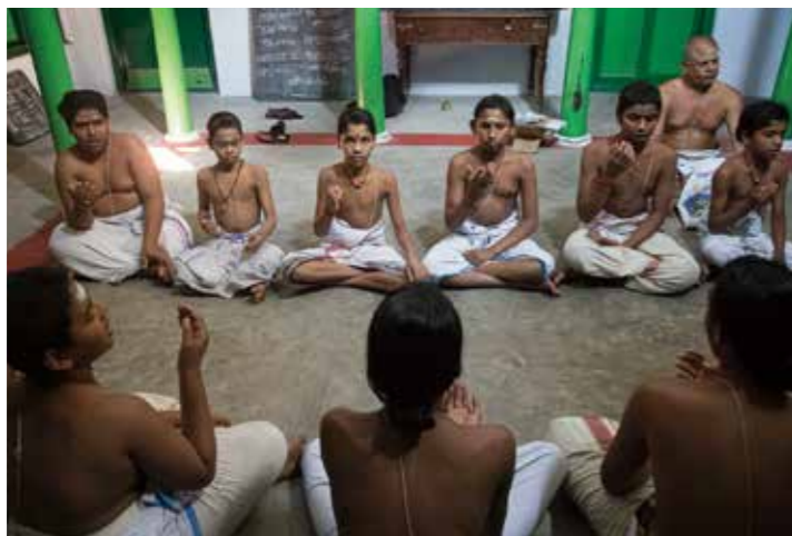
「ヴェエダ」の詠唱をする少年たち

南北インド古典音楽に共通する重要概念が「ラーガ」と「タラー」。音楽の三大要素は「メロディー」と「リズム」と「ハーモニー」と我々は学校で習ってきたが、インドではハーモニーの概念を発達させずに、独自の「ラーガ」と「タラー」という概念を発展させてきた。「ラーガ」はメロディーに関する膨大な体系。